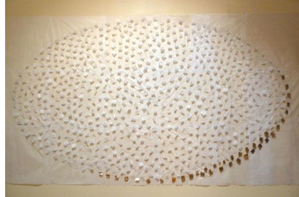
The Oracle: Tell Me a Secret, 2011. 2.5 x 1.5 m.